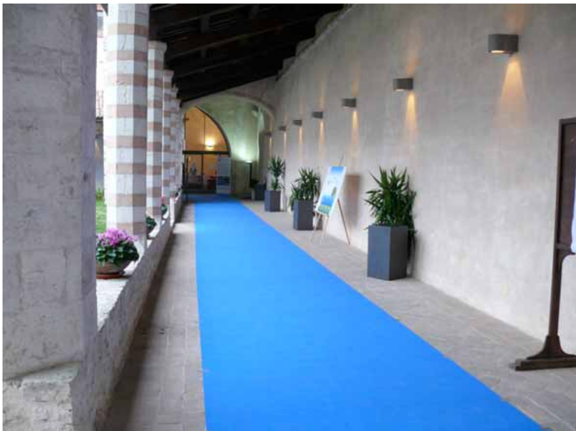
L'ingresso dell'area dei lavori del seminario