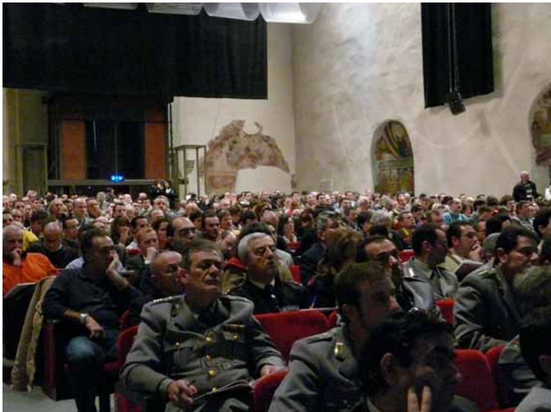
La sala del seminario con i 600 partecipanti