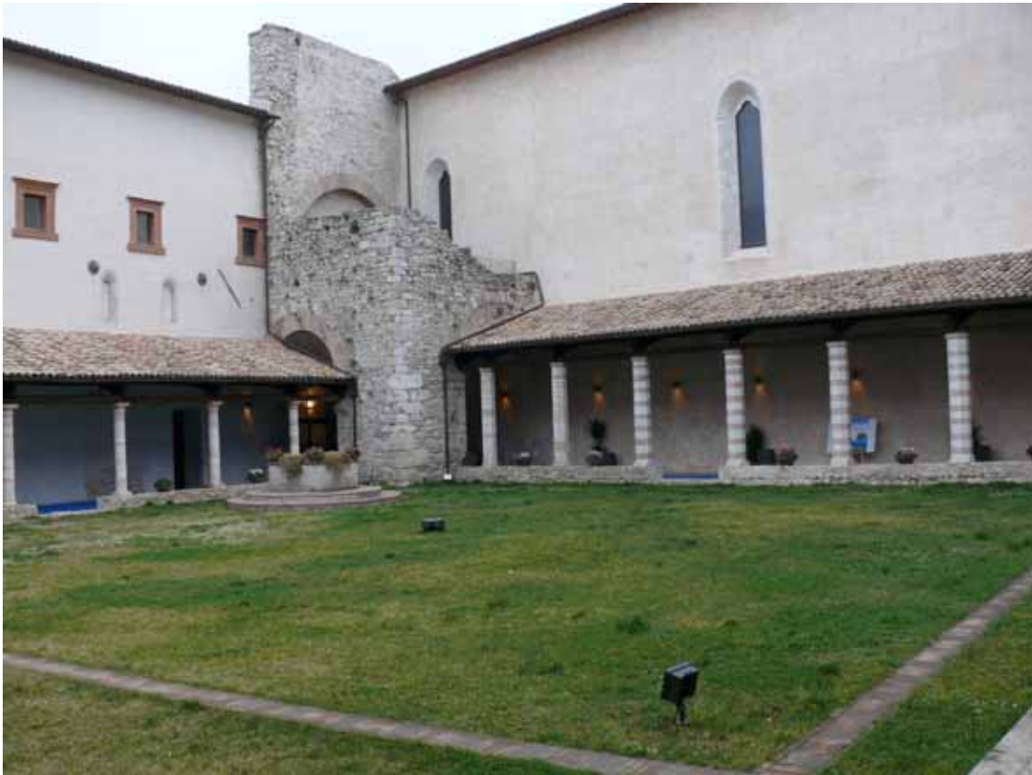
La stupenda cornice del Chiostro San Nicolò a Spoleto ove si sono svolti i lavori del seminario

Straordinario successo per il seminario sul tema “Rifiuti e risorse idriche nel secondo correttivo al Testo Unico ambientale e la disciplina delle bonifiche” organizzato il 29 febbraio 2008 dall’ ATO3 Umbria e Comune di Spoleto in collaborazione con “Diritto all’ambiente – Corsi & Formazione”: 600 partecipanti a Spoleto, provenienti da tutta Italia per un evento formativo che ha rappresentato uno dei primi seminari sulla recente revisione del T.U. ambientale. Le iscrizioni sono state chiuse in anticipo il 10 febbraio stante l’esaurimento dei posti disponibili in sala già nei primi giorni di lancio dell’evento. L’appuntamento ha visto presente un pubblico proveniente da tutta Italia e costituito da forze di polizia statali e locali, personale ARPA, tecnici della pubblica amministrazione, uffici ambiente di enti territoriali ed ATO, volontari delle associazioni ambientaliste, guardie volontarie. Nella suggestiva e prestigiosa cornice del Chiostro San Nicolò, i partecipanti hanno seguito una giornata di intensi lavori sulle recenti riforme apportate in materia di disciplina di rifiuti ed acque.