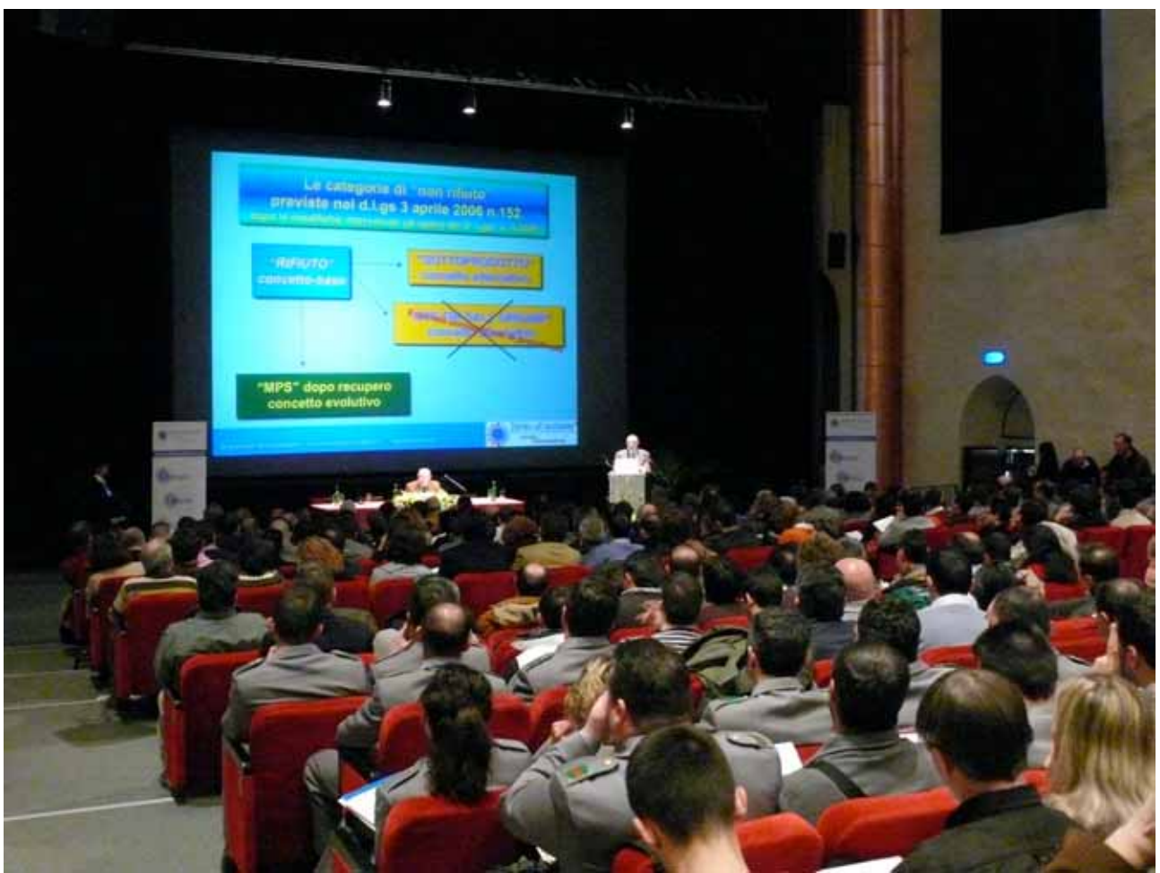
Il grande schermo del Chiostro San Nicolò ha consentito una agevole visione a tutti i partecipanti delle diapositive proiettate dai relatori

“Diritto all’ambiente – Corsi & Formazione” ringrazia il Comune di Spoleto per aver posto a disposizione il suggestivo Chiostro San Nicolò ma anche per aver riservato una intera area del parcheggio “Spoletosfera” alle auto dei partecipanti con connesso servizio navetta per facilitare l’afflusso dei 600 partecipanti al seminario. Ringrazia ancora la direzione del teatro del Chiostro San Nicolò per la disponibilità e cortesia e per aver disposto l’ampliamento dei posti in sala al fine di consentire la partecipazione a tutti gli aderenti.